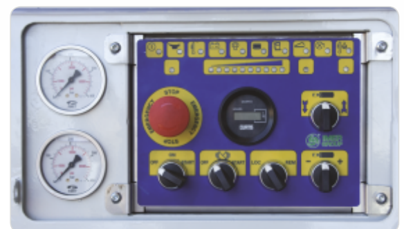
Panou de control electromecanic